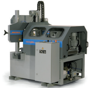
MEBApro 260 AP